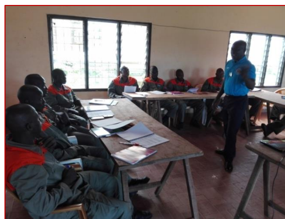
Cours théorique d'instruction civique dans la salle de conférence du Conseil Régional du Lôh Djibouah