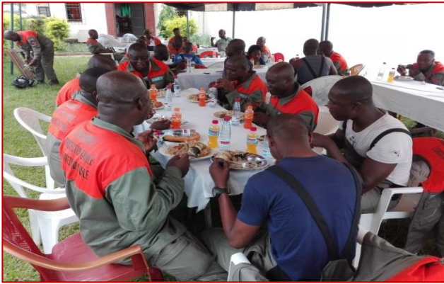
Pause déjeuner des stagiaires