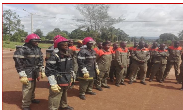
Désignation des binômes pour la Manœuvre au stade municipal de Divo