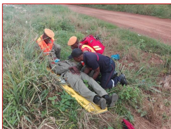
Mise en situation d'une victime éjectée