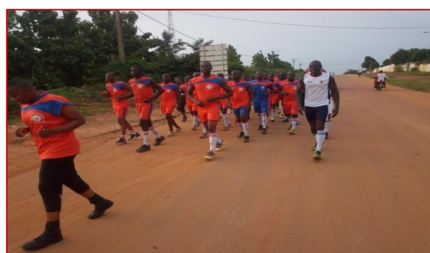
Sport matinal en ville