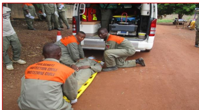
Relevage et brancardage à 3 secouristes au centre-ville