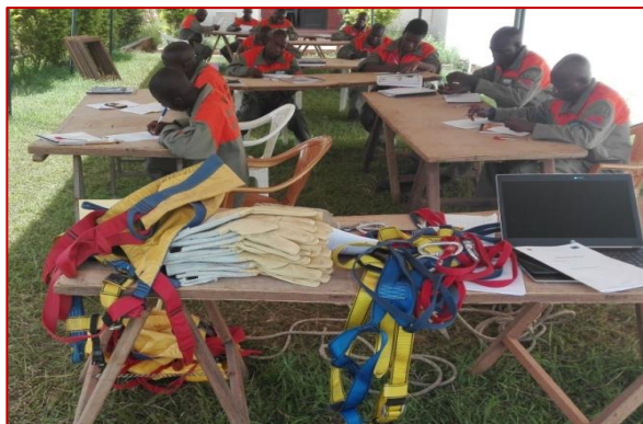
Evaluation formative en incendie