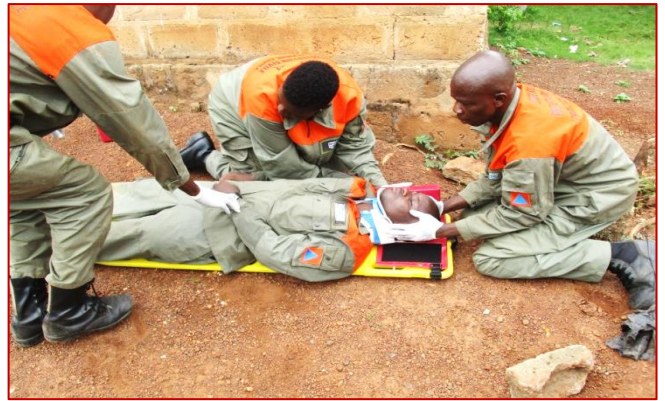
Immobilisation d'une victime consciente et traumatisée sur un plan dur