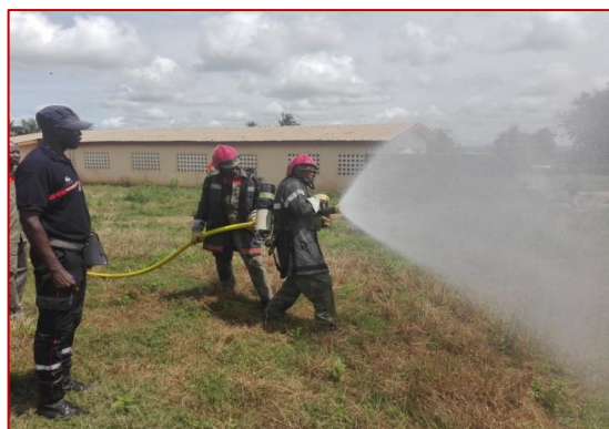
Manœuvre 3 en incendie